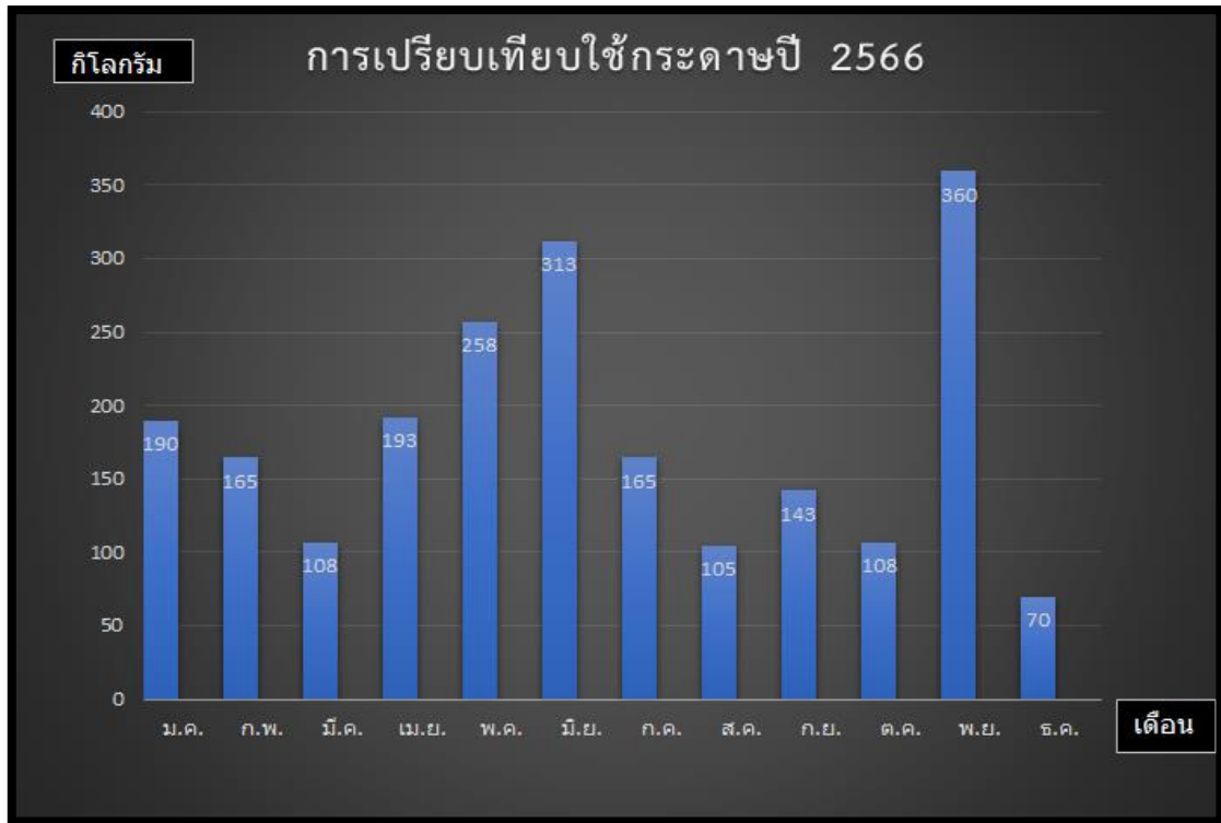
บันทึกการใช้กระดาษต่อจำนวนผู้ใช้บริการประจำปี พ.ศ. 2566