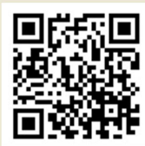
QR Code คำนวณโหลดฟอร์ม/เอกสารที่เกี่ยวข้อง

วช. จะประกาศผลการพิจารณาข้อเสนอการวิจัยและนวัตกรรมที่ผ่านการพิจารณาเบื้องต้นทางเว็บไซต์ www.nrct.go.th และ https://nriis.go.th