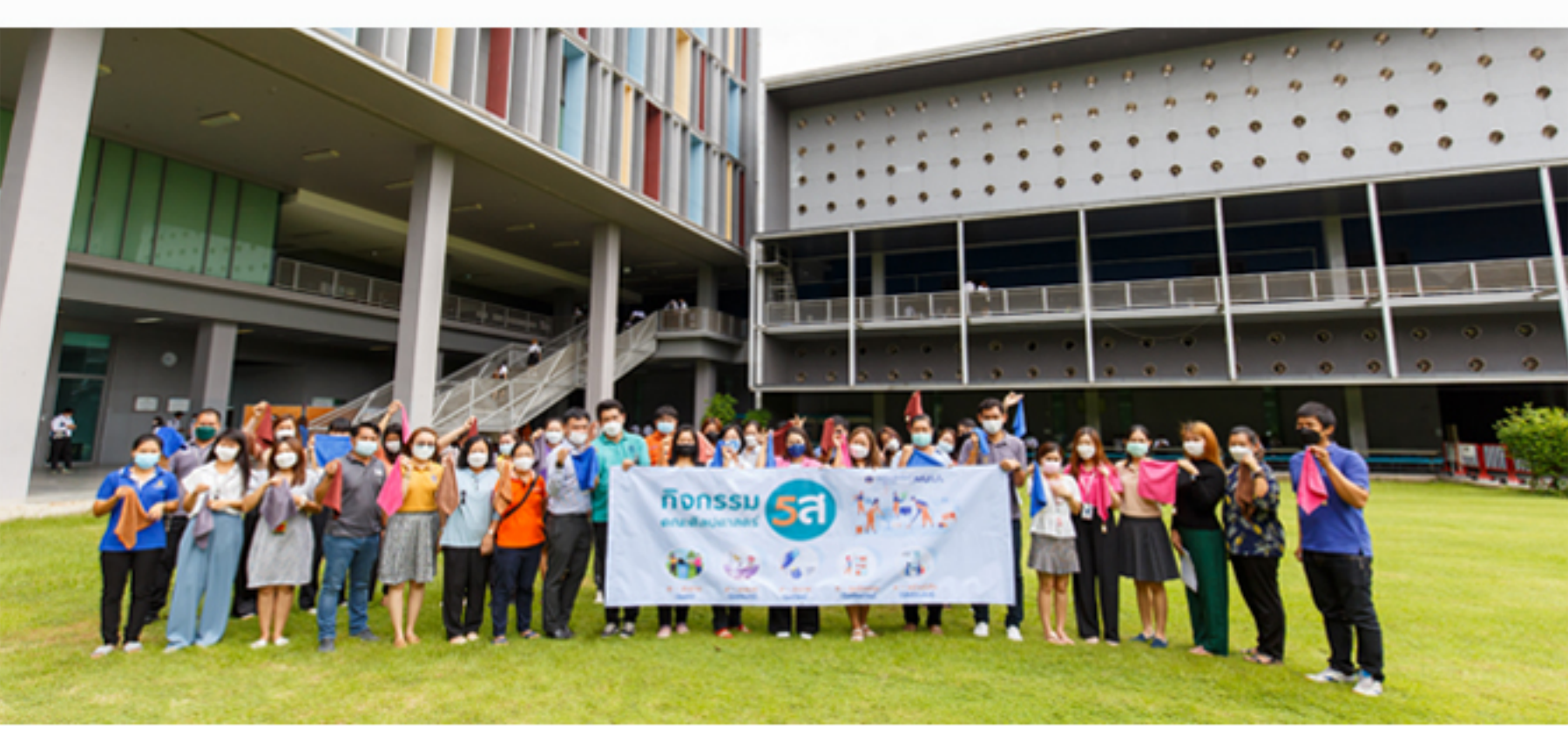
9 กันยายน 2565 กิจกรรม Big Cleaning Day ภายใต้โครงการกิจกรรม 5 ส. คณะศิลปศาสตร์ มหาวิทยาลัยมหิดล ประจำปี 2565