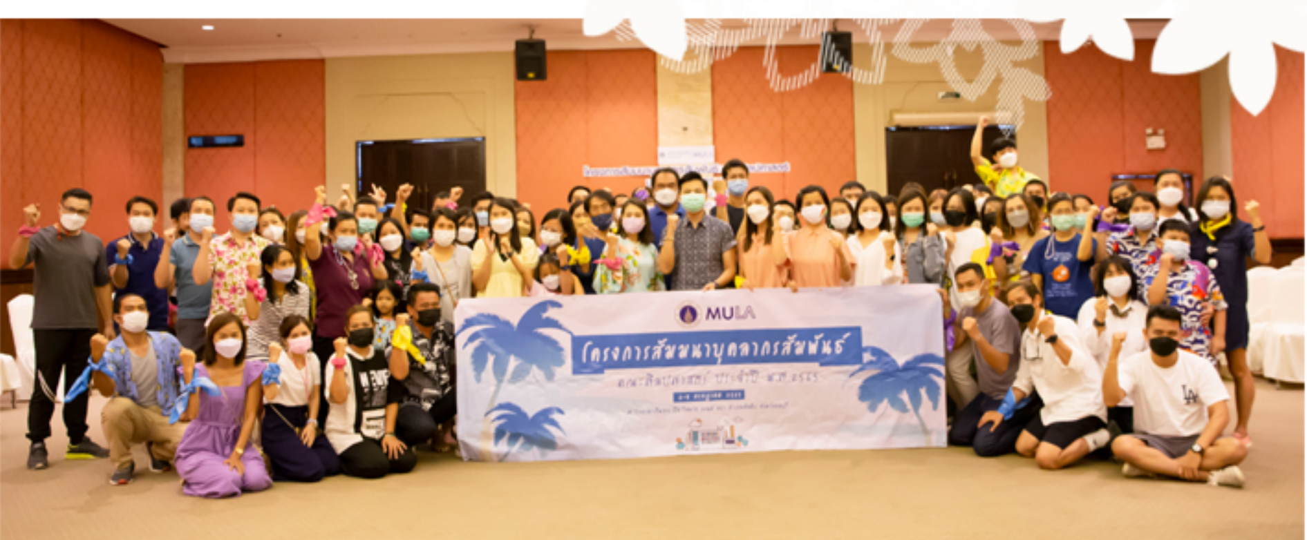
6 - 8 กรกฎาคม 2565 โครงการสัมมนาบุคลากรสัมพันธ์ คณะศิลปศาสตร์ ประจำปี 2565 ณ โรงแรมราวีรินทร์ บีช รีสอร์ท แอนด์ สปา อำเภอสัตตหีบ จังหวัดชลบุรี