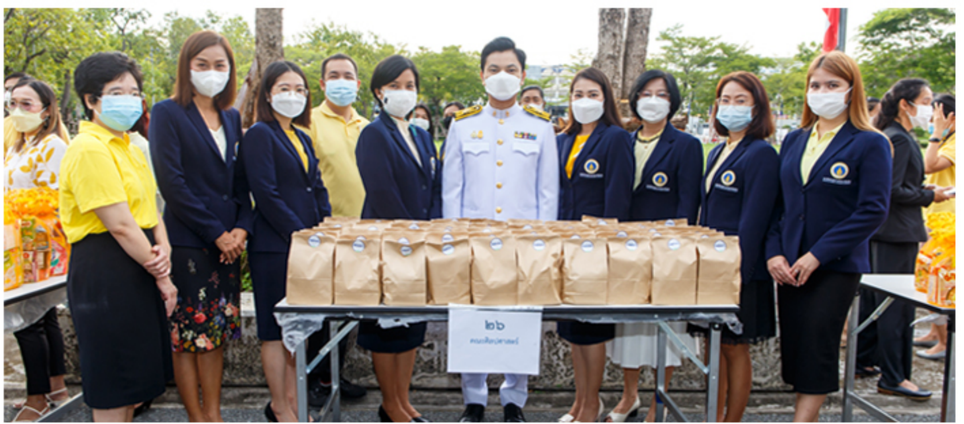
27 กรกฎาคม 2565 พิธีทำบุญตักบาตรข้าวสารอาหารแห้งแด่พระสงฆ์และสามเณร จำนวน 70 รูป เนื่องในโอกาสวันเฉลิมพระชนมพรรษาพระบาทสมเด็จพระเจ้าอยู่หัว 70 พรรษา ณ สำนักงานอธิการบดี มหาวิทยาลัยมหิดล