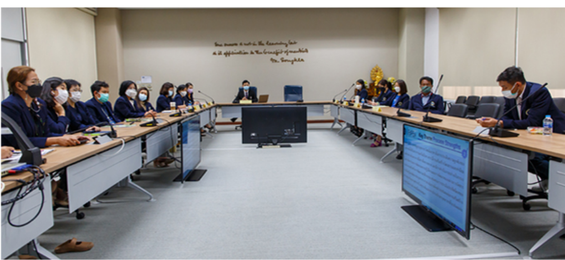
21- 22 กันยายน 2565 การตรวจประเมินตามเกณฑ์คุณภาพการศึกษาเพื่อการดำเนินการที่เป็นเลิศ (Education Criteria for Performance Excellence: EdPEX) ประจำปี 2565