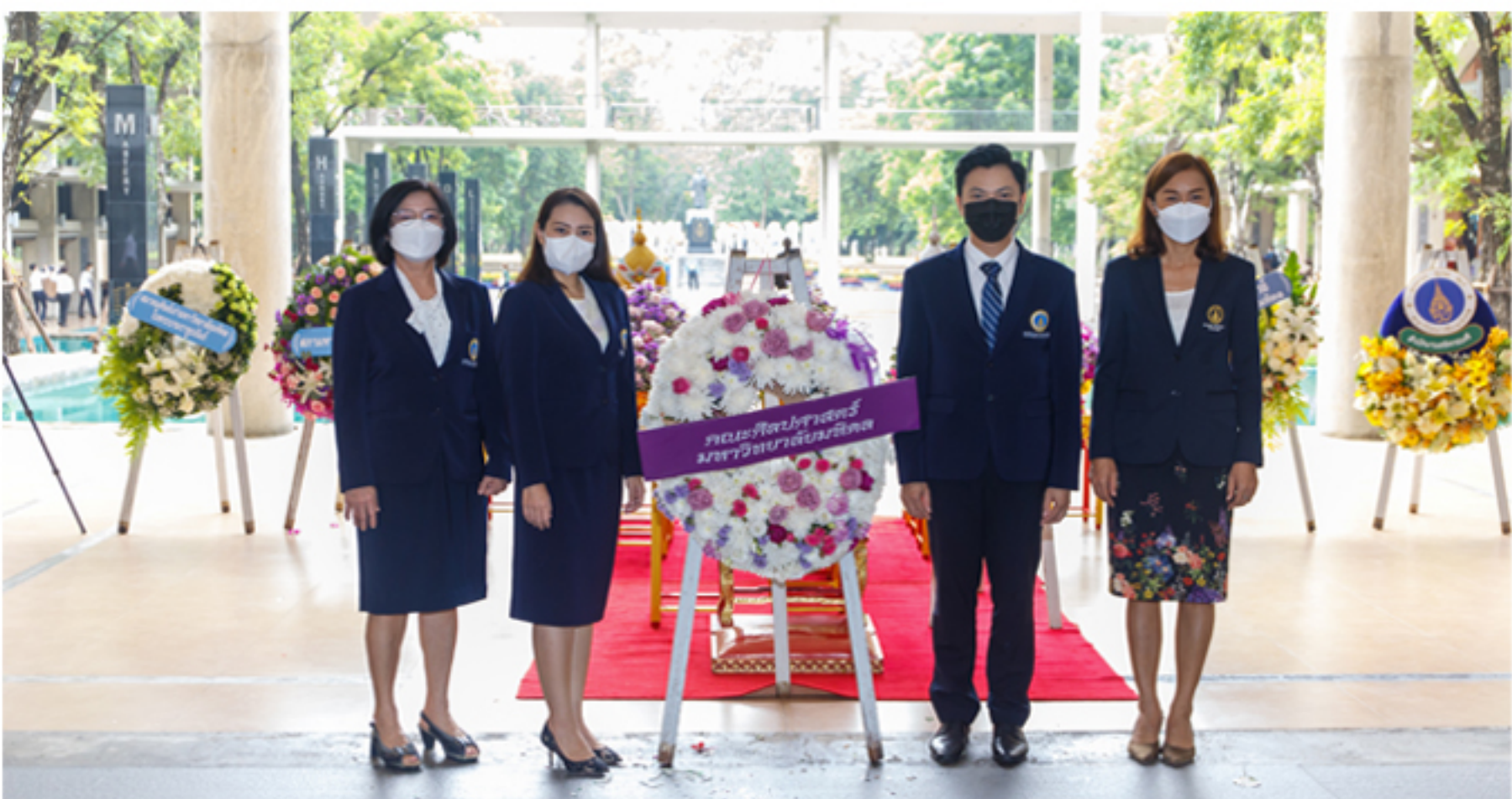
24 กันยายน 2565 พิธีวางพวงมาลาถวายราชสักการะ พระราชานุสาวรีย์สมเด็จพระมหิตลาธิเบศร อดุลยเดชวิกรม พระบรมราชชนก เนื่องในวันมหิดล ประจำปี 2565 ณ ลานพระราชานุสาวรีย์ ศูนย์การเรียนรู้มหิดล มหาวิทยาลัยมหิดล ศาลายา