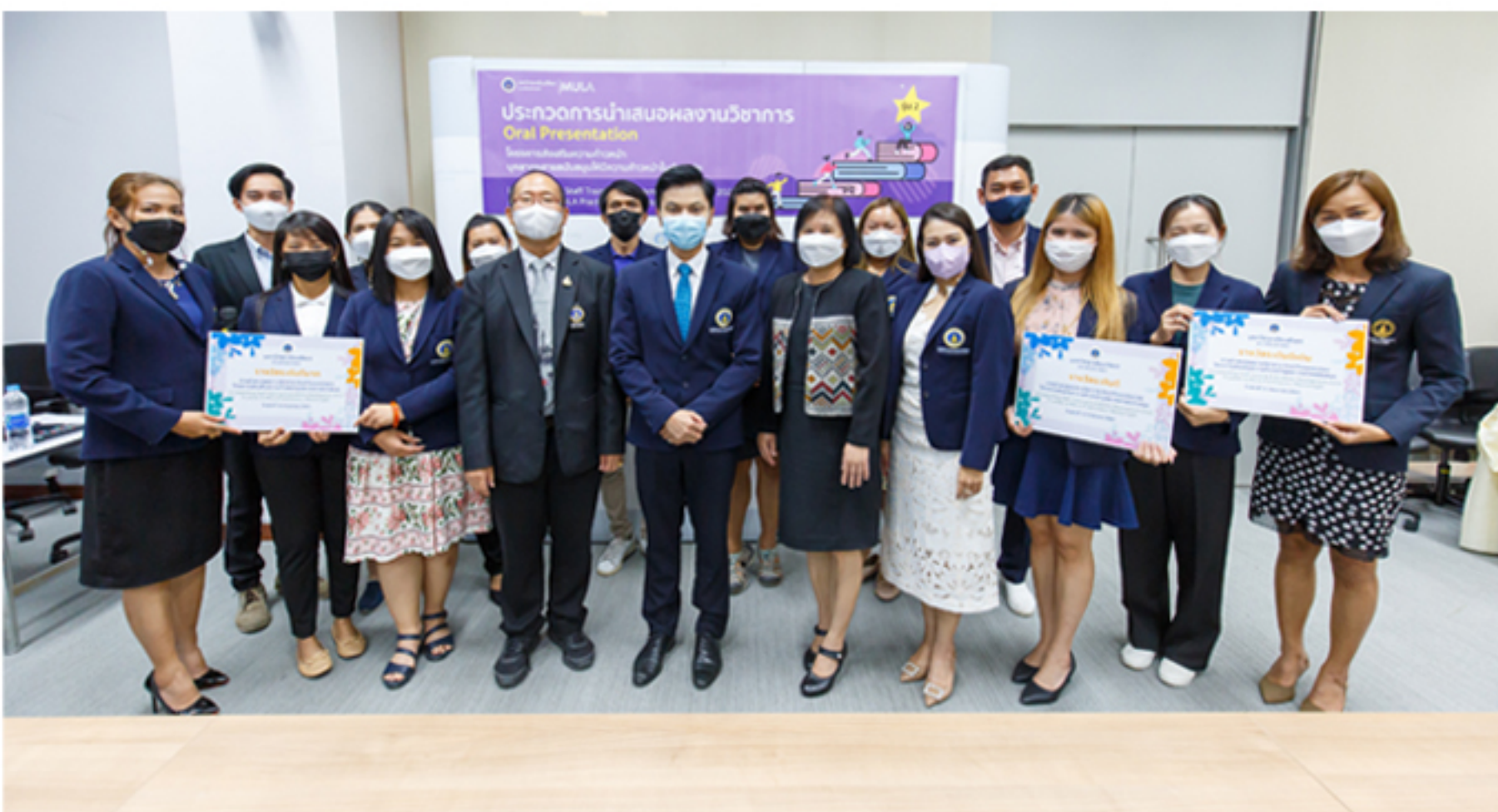
23 กันยายน 2565 การประกวดนำเสนอผลงาน Oral Presentation ในโครงการส่งเสริมความก้าวหน้าบุคลากรสายสนับสนุนให้มีความก้าวหน้าในตำแหน่ง รุ่น 2 (LA Supporting Staff Training & Academic Development 2021: A Ladder to MULA Practitioners/ Mentoring#2)