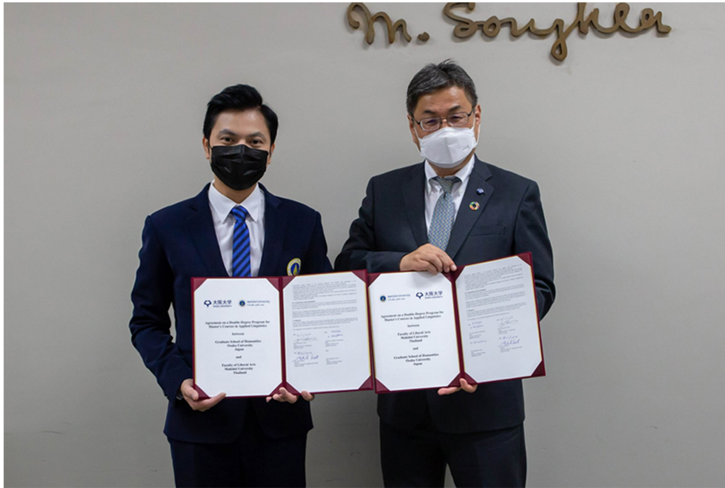
วันที่ 23 สิงหาคม 2565

พิธีลงนามบันทึกความร่วมมือทางวิชาการครั้งนี้ มีวัตถุประสงค์เพื่อประสานความร่วมมือระหว่างคณะศิลปศาสตร์ และคณะแพทยศาสตร์ศิริราชพยาบาล ในการร่วมมือกันพัฒนาระบบการดูแลสุขภาพด้านการท่องเที่ยวที่สามารถตอบสนองความต้องการของประเทศ รวมทั้งสร้างความร่วมมือด้านวิชาการ และแลกเปลี่ยนองค์ความรู้ร่วมกันส่งเสริม สนับสนุน และพัฒนาบุคลากรให้มีองค์ความรู้และทักษะด้านการท่องเที่ยวและสุขภาพ