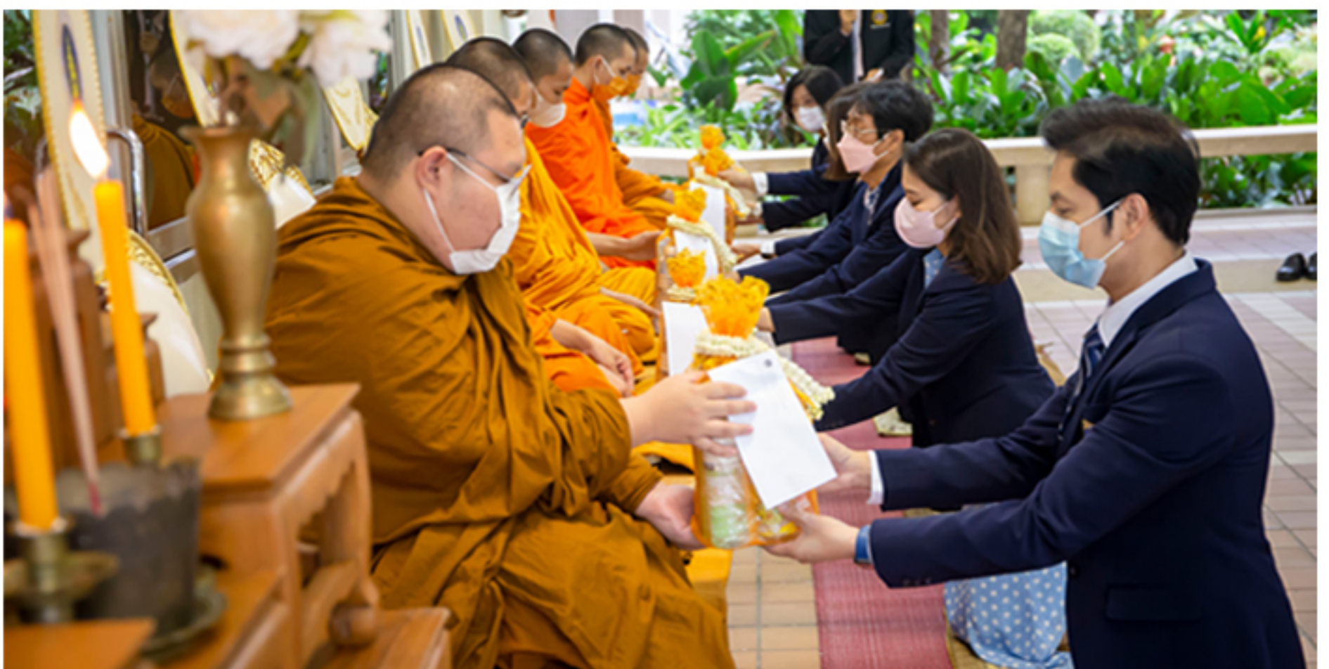
26 สิงหาคม 2565 กิจกรรมทำบุญเดือนเกิด เนื่องในโอกาสคณะศิลปศาสตร์เป็นเจ้าภาพ ทำบุญเดือนเกิดประจำเดือนสิงหาคม 2565 จัดโดย วิทยาลัยศาสนศึกษา มหาวิทยาลัยมหิดล