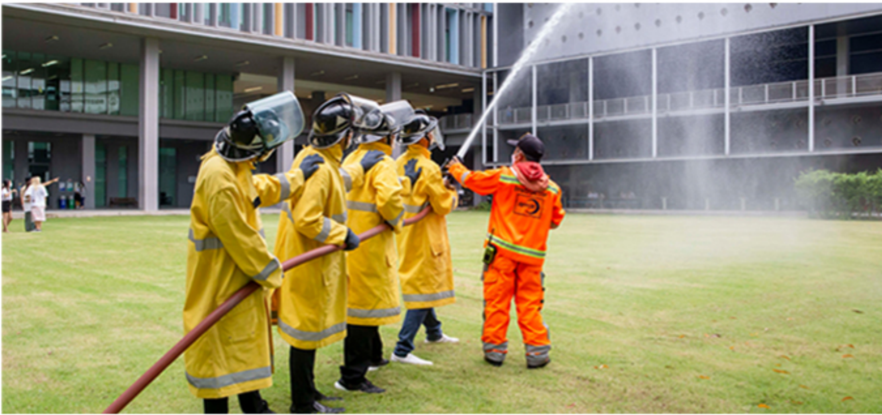
14 กันยายน 2565 โครงการฝึกซ้อมดับเพลิงและอพยพหนีไฟ ประจำปี พ.ศ. 2565