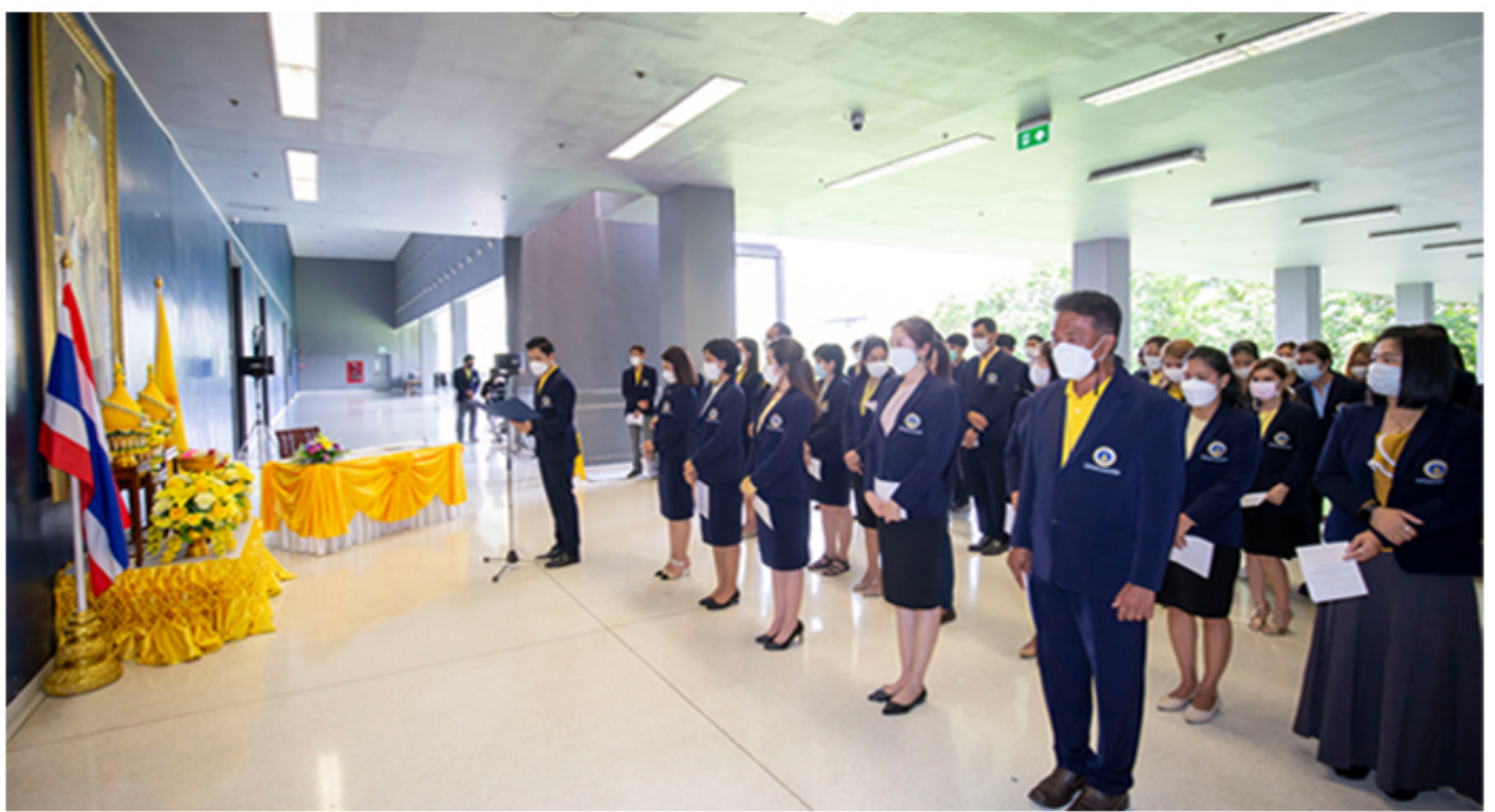
25 กรกฎาคม 2565 กิจกรรมเฉลิมพระเกียรติเนื่องในโอกาสวันเฉลิมพระชนมพรรษา พระบาทสมเด็จพระเจ้าอยู่หัว ณ หน้าพระบรมฉายาลักษณ์ ชั้น 2 อาคารสิริวิทยา คณะศิลปศาสตร์