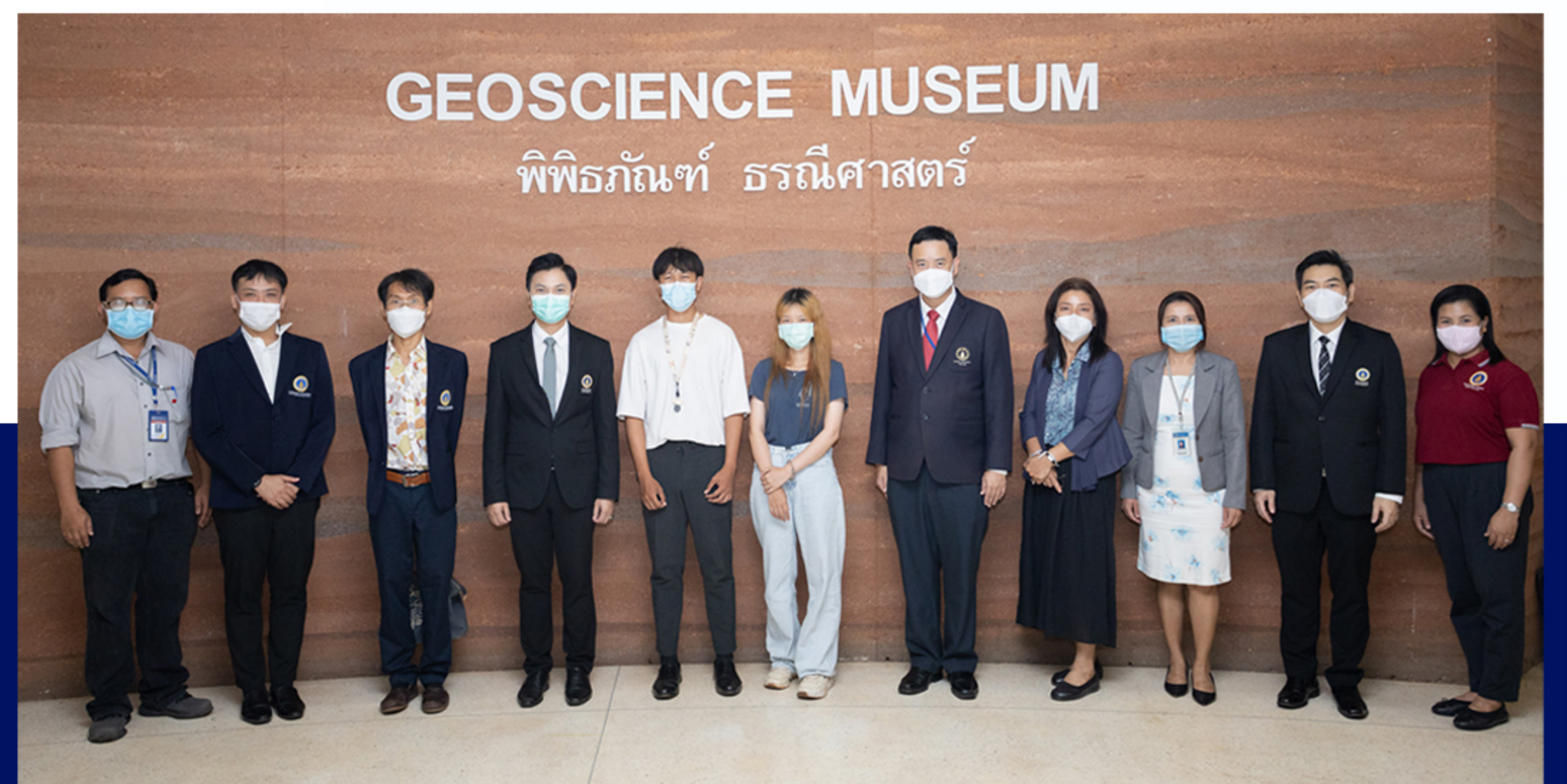
4 สิงหาคม 2565

ในโอกาสนี้ยังได้เข้าเยี่ยมชมสำนักงาน Joint Campus Osaka University ณ ชั้น 1 อาคารสิริวิทยา คณะศิลปศาสตร์ มหาวิทยาลัยมหิดล ศาลายา ด้วย