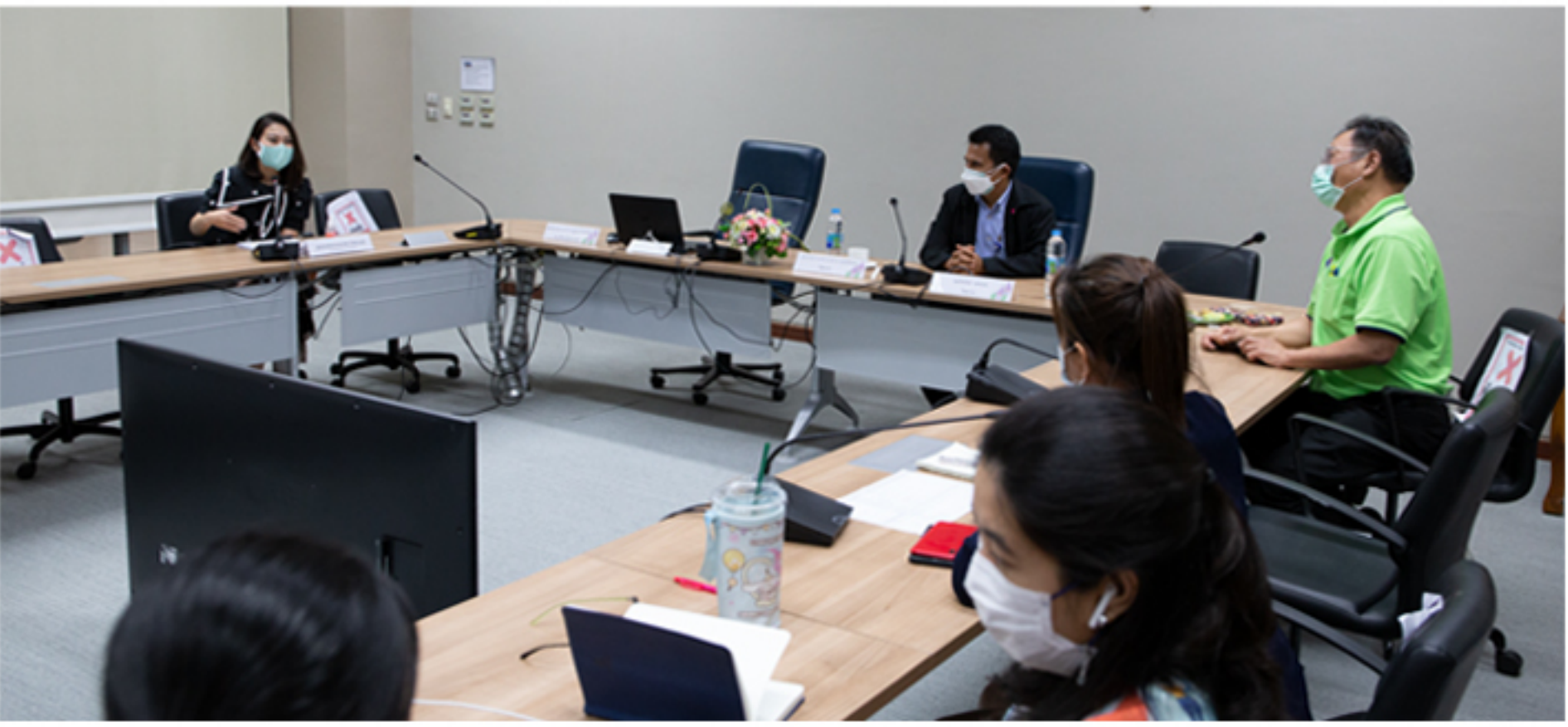
19 กรกฎาคม 2565 กิจกรรมให้คำปรึกษาและเสนอแนะด้านการจัดการสิ่งแวดล้อมในโครงการสำนักงานสีเขียว (Green Office)