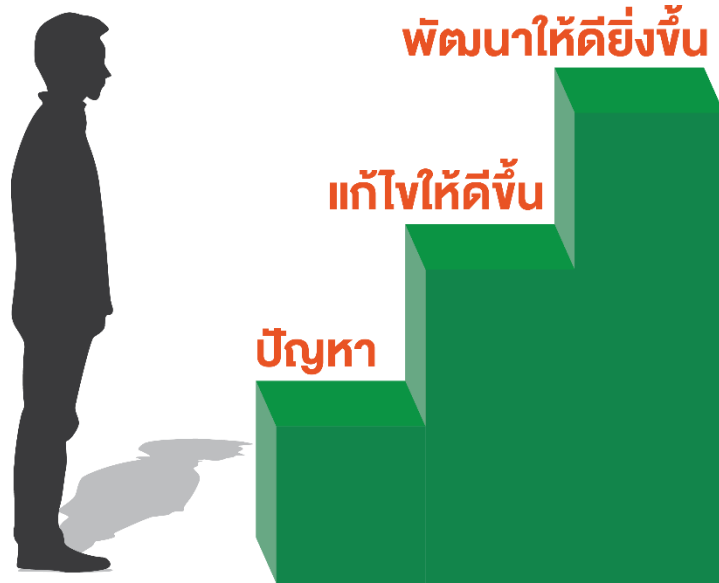
ขั้นตอนการทำ R2R

R2R (Routine 2 Research) การปรับปรุงหรือพัฒนางานประจำโดยใช้กระบวนการวิจัยมาปรับปรุงพัฒนางานประจำให้มีประสิทธิภาพและมีประสิทธิผลมากขึ้นรวมถึงการประหยัดทรัพยากร