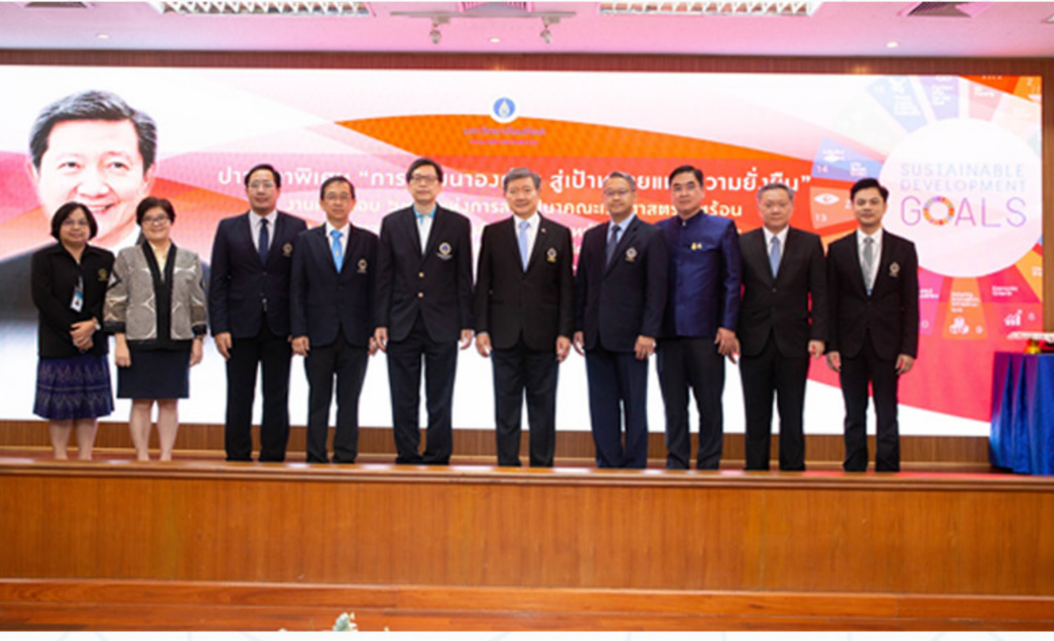
5 เมษายน 2566 คณะศิลปศาสตร์ เข้าร่วมงานครบรอบ 63 ปี แห่งการสถาปนาคณะเวชศาสตร์เขตร้อน