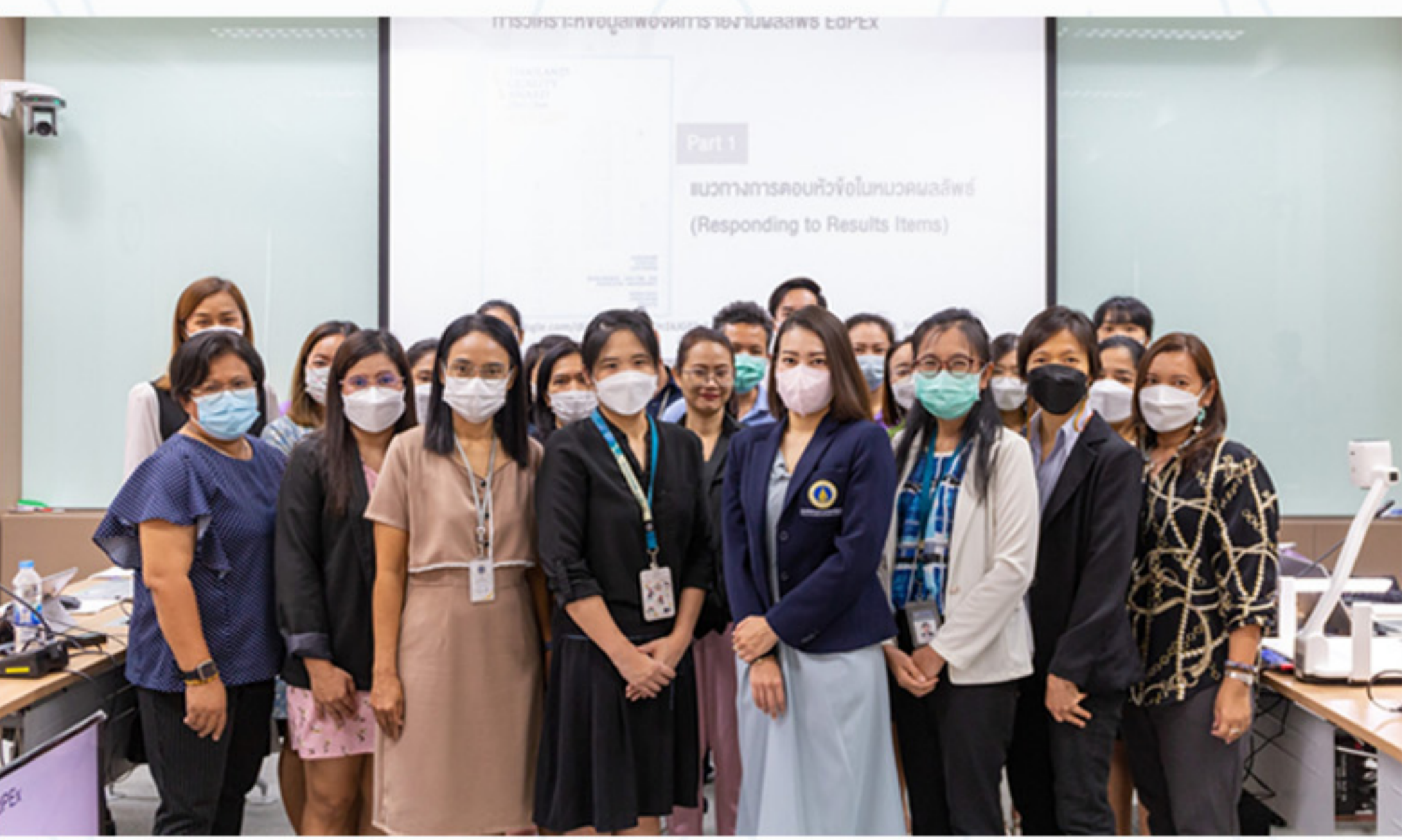
21 เมษายน 2566 โครงการอบรมการวิเคราะห์ข้อมูลเพื่อจัดทำรายงาน EdPEX