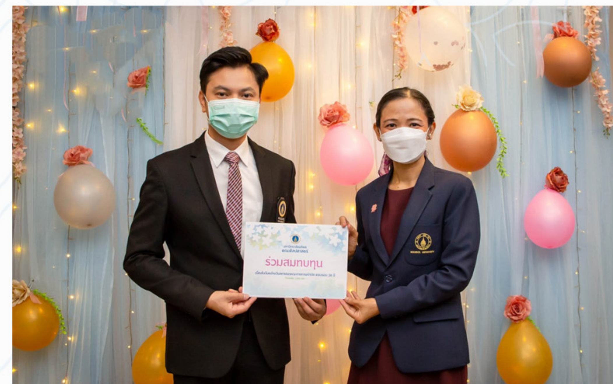
18 พฤษภาคม 2566 คณะศิลปศาสตร์ เข้าร่วมงานครบรอบ 58 ปี วันคล้ายวันสถาปนา คณะกายภาพบำบัด