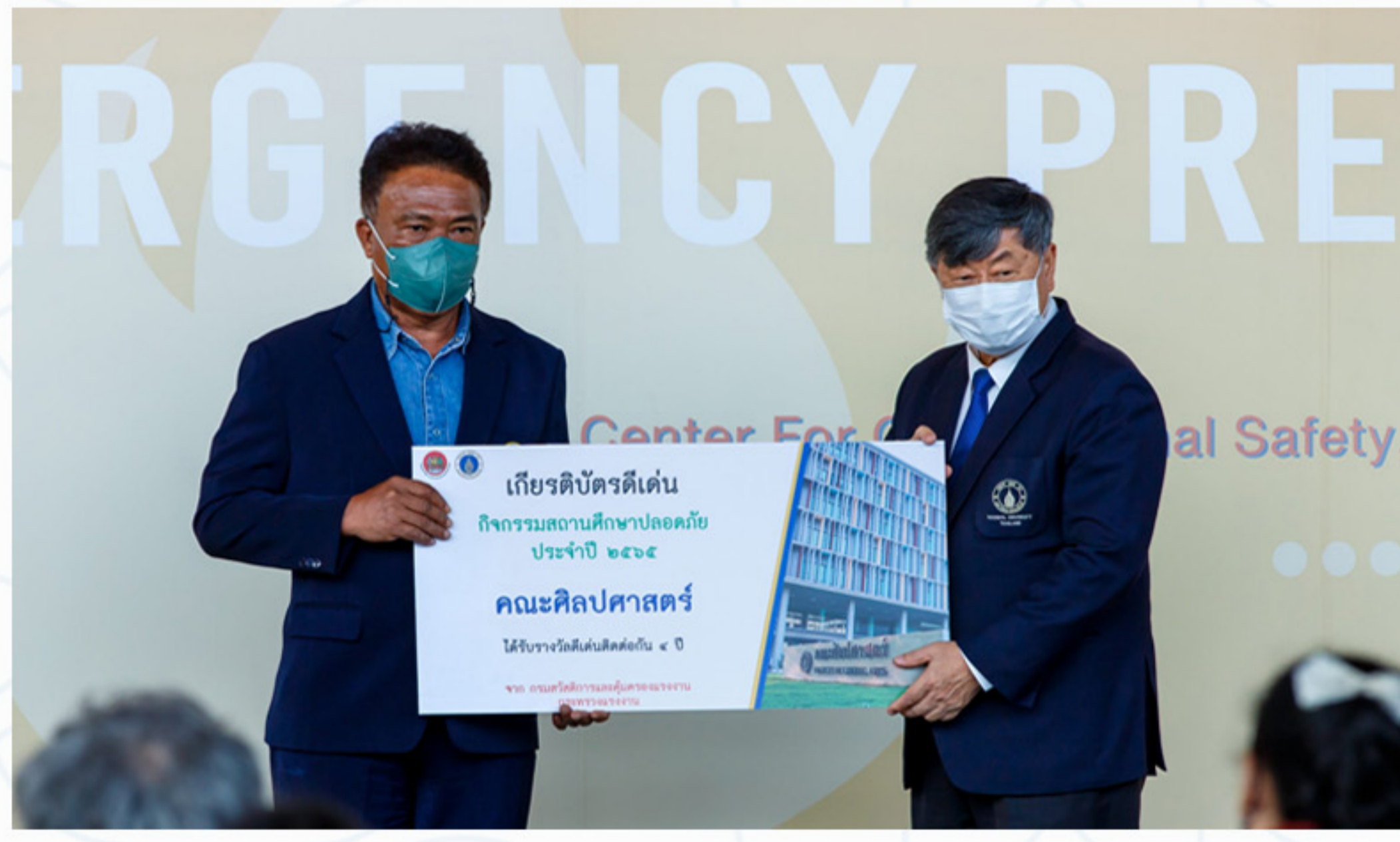
28 เมษายน 2566 คณะศิลปศาสตร์ เข้ารับรางวัลสถานศึกษาปลอดภัยดีเด่น จากผลการตรวจประเมิน "สถานศึกษาปลอดภัย" ประจำปี 2565 จัดโดยกรมสวัสดิการและคุ้มครองแรงงาน กระทรวงแรงงาน