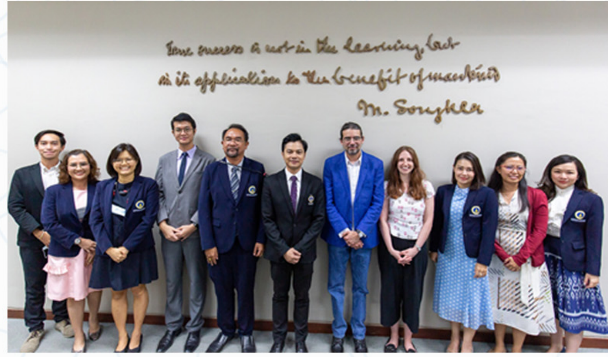
9 พฤษภาคม 2566 คณะศิลปศาสตร์ ให้การต้อนรับผู้บริหารจาก University of Leeds สหราชอาณาจักร