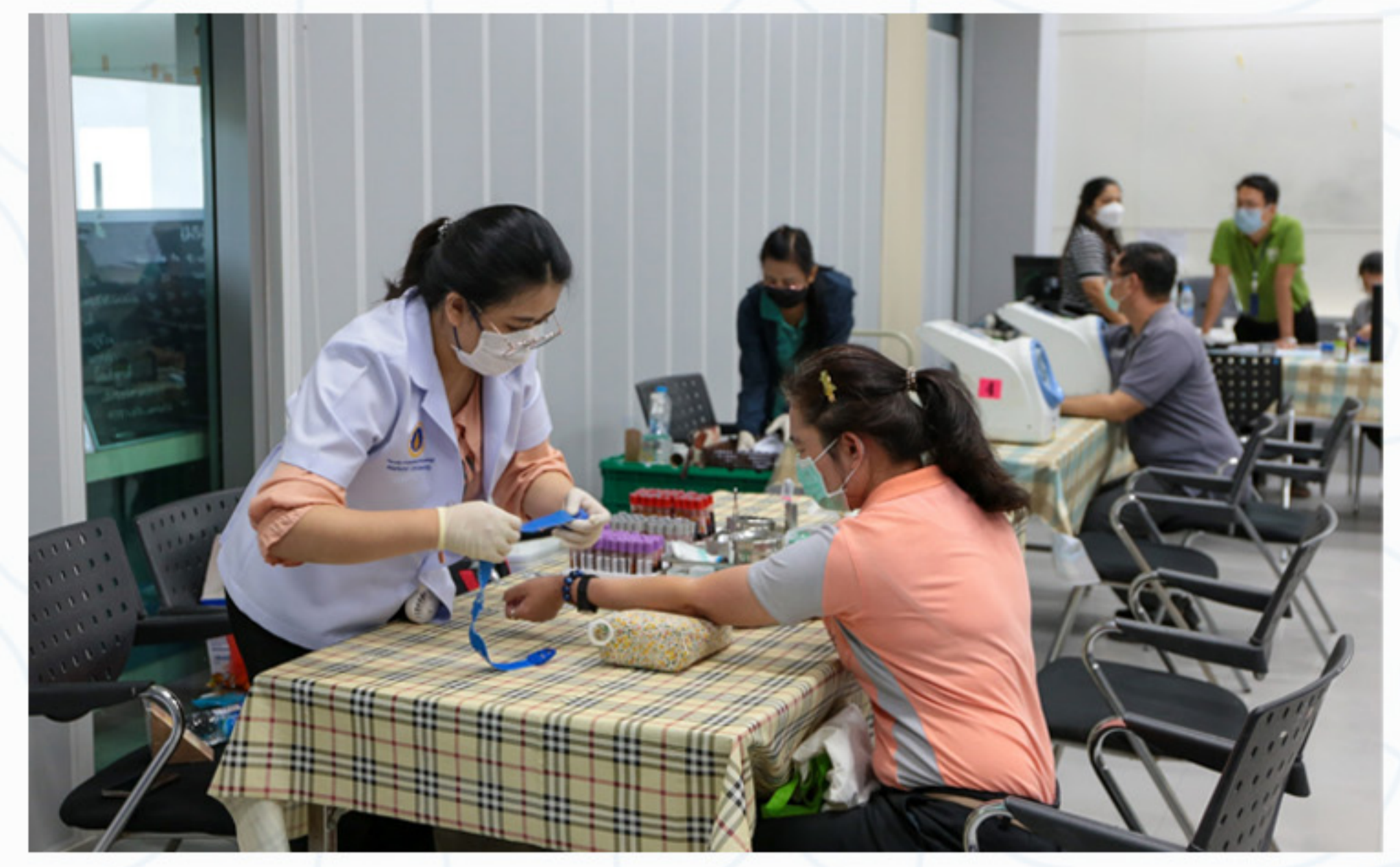
24 พฤษภาคม 2566 โครงการตรวจสอบคุณภาพประจำปีงบประมาณ พ.ศ. 2566 คณะศิลปศาสตร์