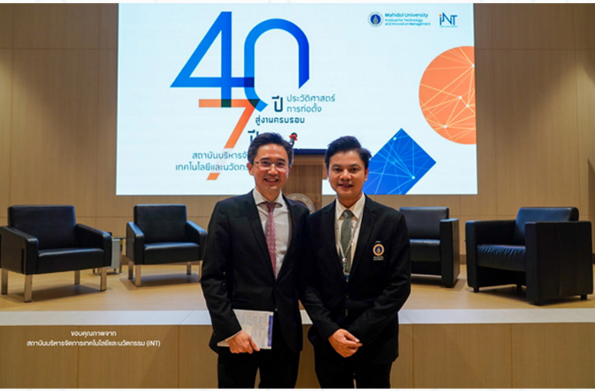
19 เมษายน 2566 คณะศิลปศาสตร์ ร่วมงาน "40 ปี ประวัติศาสตร์การก่อตั้งสู่งานครบรอบ 7 ปี สถาบันบริหารจัดการเทคโนโลยีและนวัตกรรม (INT)"