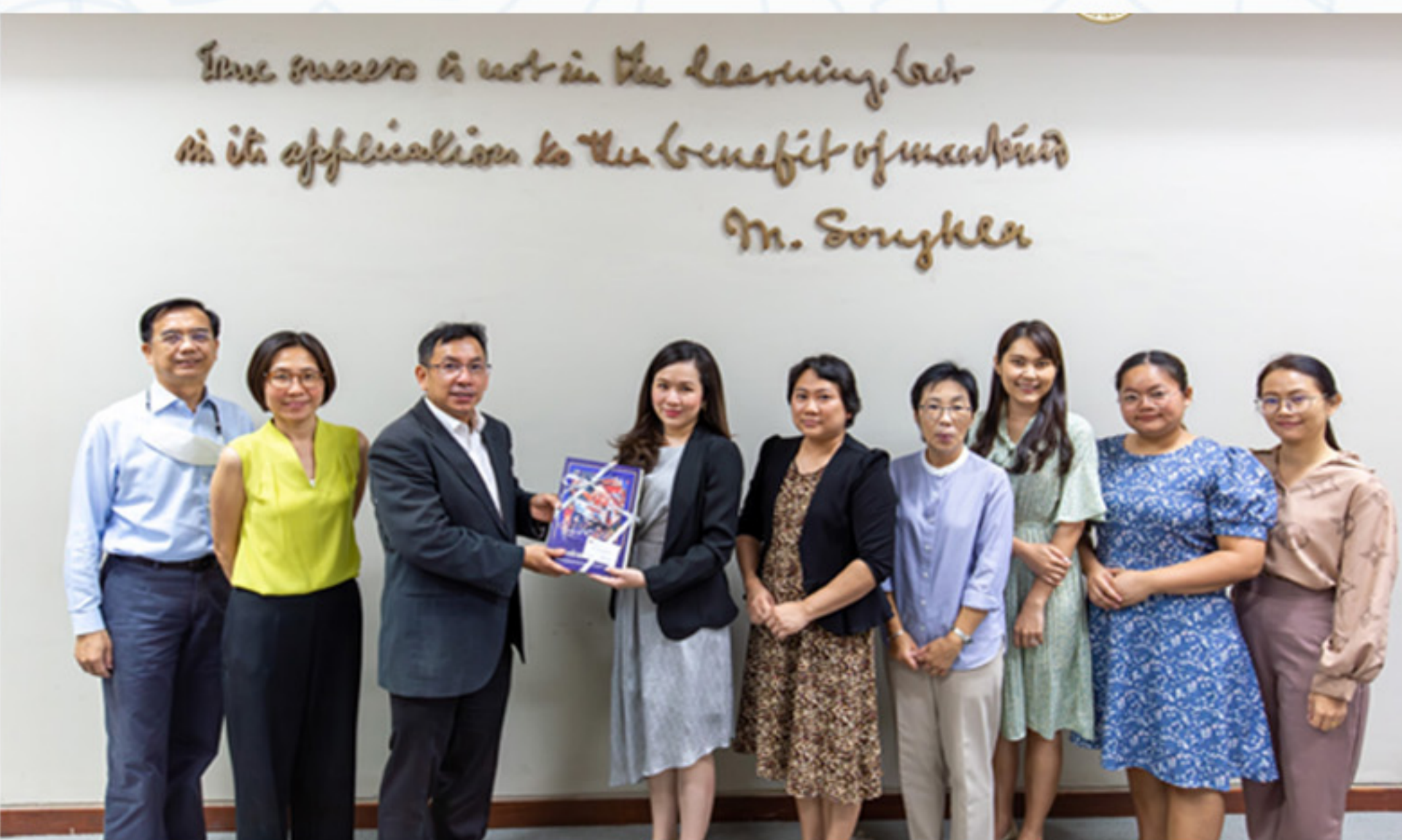
27 เมษายน 2566 คณะศิลปศาสตร์ ให้การต้อนรับทีมวิชาการ SE-ED Academy บริษัทซีเอ็ดยูเคชั่น จำกัด (มหาชน)