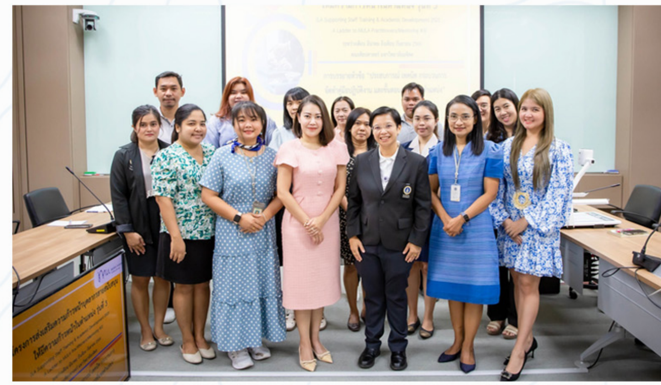
18 พฤษภาคม 2566 โครงการส่งเสริมความก้าวหน้าบุคลากรสายสนับสนุน ให้มีความก้าวหน้าในตำแหน่ง รุ่น 3 (LA Supporting Staff Training & Academic Development 2023: A Ladder to MULA Practitioners/ Mentoring#3)