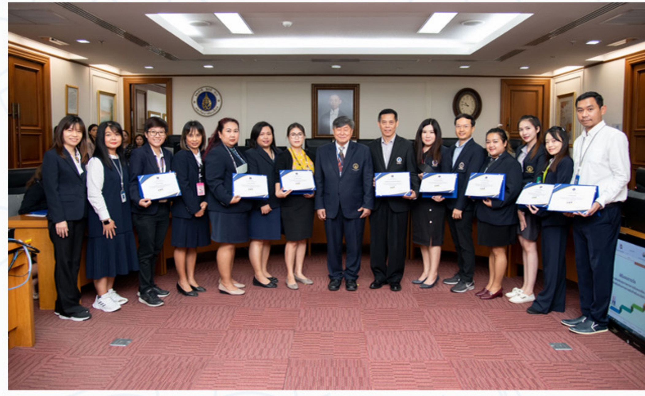
15 พฤษภาคม 2566 คณะศิลปศาสตร์ เข้ารับเกียรติบัตรรางวัล "ส่วนงานส่งเสริมสุขภาพทางการเงินยอดเยี่ยม" ภายใต้โครงการส่งเสริมทักษะทางการเงินสำหรับคนวัยทำงาน (Fin ดี Happy Life)