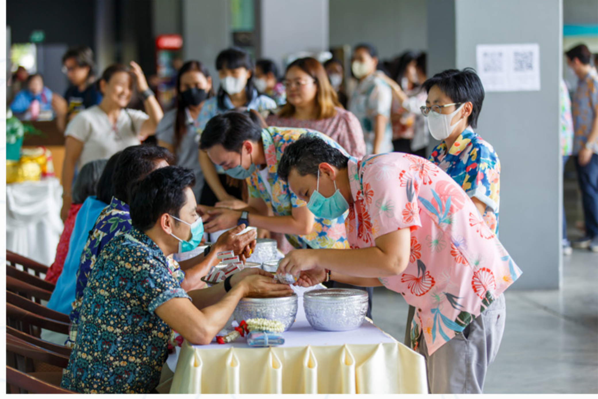
11 เมษายน 2566 กิจกรรมวันสงกรานต์ คณะศิลปศาสตร์ ประจำปี 2566